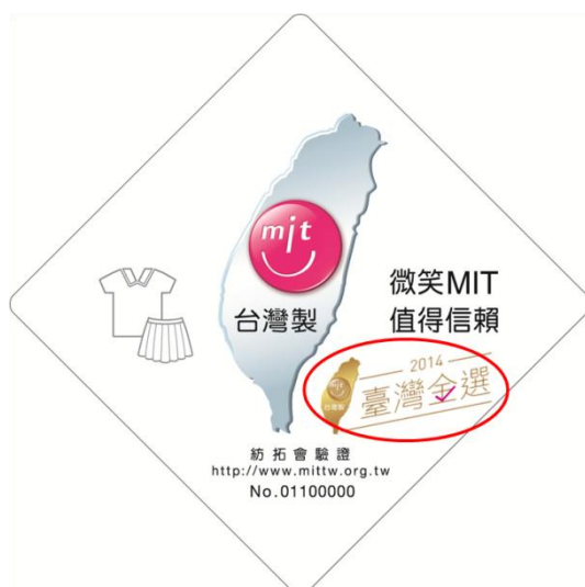
吊牌錯誤使用樣式