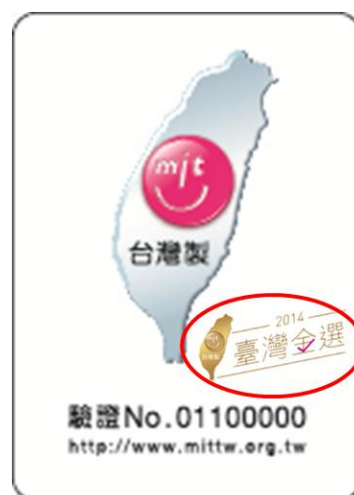
貼紙錯誤使用樣式